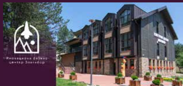
Иновациони бизнис центар Златибор

У згради Културног центра на Златибору у оквиру Иновационог бизнис центра почео је са радом први „хуб“, заједнички простор рад. Овај у потпуности канцеларијски опремљен простор могу да користе сви мештани и посетиоци Златибора. У заједничком простору за рад ("coworking space") заинтересованим се нуди бежични интернет, радни сто, рачунар и штампач. Златибор је овим добио нови, савремени садржај који пружа могућност фриленсерима, младим зачетницима стартап бизниса и свима којима је док бораве на планини потребан инспиративан и савремено опремљен простор за рад. Пандемија коронавируса условила је да се многи послови обављају онлајн, а млади људи бежећи из градова у природу све више траже простор где могу спојити лепо и корисно. Што им Златибор, отварањем савременог заједничког простора за рад, сада омогућава.