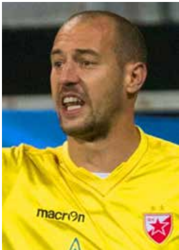
Милан Борјан, голман и капитен Фудбалског клуба Црвена звезда