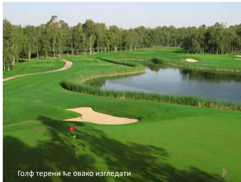
Голф терени ће овако изгледати